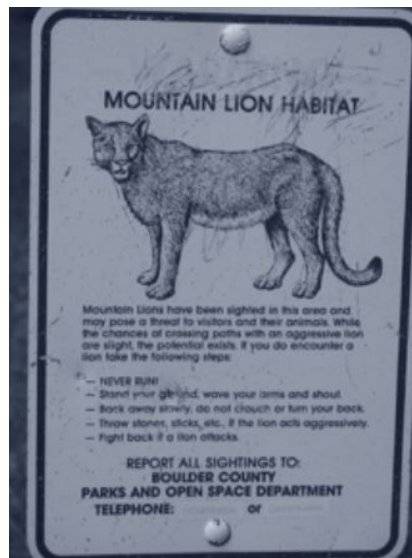
Cartel en el área de las Flatirons.

Además de presenciar y participar en las actividades e investigar en la biblioteca, fui invitada a caminar en las montañas. Como ya lo dije, son el orgullo de Boulder, y cuando llegué mis huéspedes no tardaron ni diez minutos en preguntarme si quería conocerlas. Parece que es una actividad de lo más común, y boulderites de todas las edades caminan en las Flatirons, con o sin perros. El aire puro y fresco y las imponentes vistas lo sumergen a uno en un estado de vitalidad y calma sorprendente, y me quedó más claro porque todos parecían tan serenos y apacibles. Nos encontramos con ciervos y varios tipos de pájaros, cascadas, llanos infinitos, y siempre, a lo lejos, las cimas blancas de las Rocky Mountains. Los pueblitos alejados, fundados por aventureros en busca de oro, presentan un ambiente entre apacible y rudo. No quise imaginarme este paisaje en invierno, tan aislado y frío. Me habían advertido que en esas montañas viven pumas, y me indicaron lo que había que hacer si me encontraba con alguno de esos felinos. Creo que me faltan muchas horas de meditación para resistir las ganas de salir corriendo de tan poderoso encuentro.