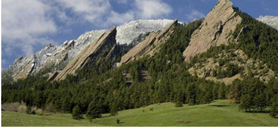
Imagen 1. Cordillera de las Rocky Mountains.

más imponentes de lo que ya eran. Y justo antes de las rocas, Boulder, como un apacible pueblo suizo, limpio y ordenadito, acaudalado y verde.