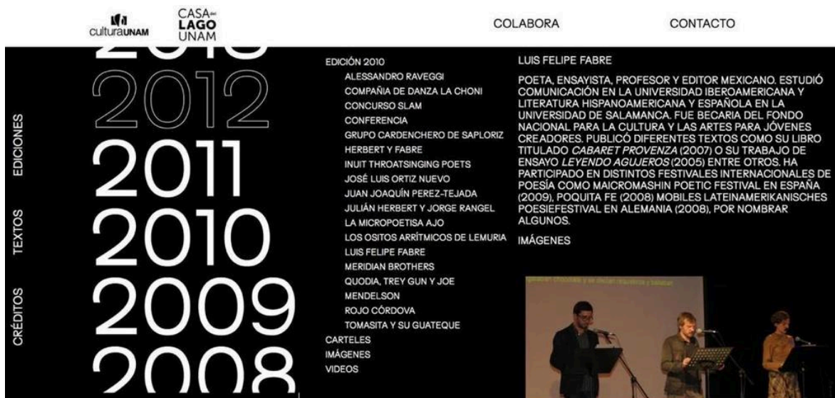
Toma de pantalla del archivo de Poesía en Voz Alta, a inaugurarse el 7 de noviembre de 2020

Nos interesa también recopilar estos documentos que nos llegan de todo mundo. Los documentos que tenemos mayormente son programas de mano, flyers, algunas fotografías y videos. Pero, como este es un archivo digital, es interesante cómo algunos archivos nunca tocaron la materialidad. Muchas de las fotos de 2005 a 2020 son enteramente digitales, las perdemos en un disco duro o en el celular, entonces también es interesante rescatar este archivo más contemporáneo.