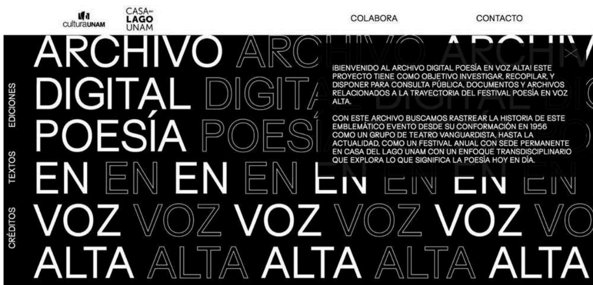
Toma de pantalla del archivo de Poesía en Voz Alta, a inaugurarse el 7 de noviembre de 2020