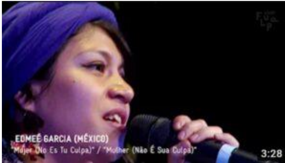
Imagen de la representación tomada del blog de la artista ( https://diosaloca.mx )

El video: ( https://www.youtube.com/watch?v=TE1NvAbVuel )